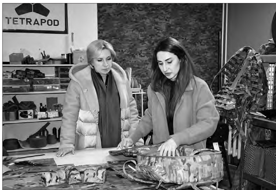
Ірина Верещук (ліворуч) високо оцінила вироби цеху Оксани Макарової.

Ретельно оглянувши виготовлене жінками військове спорядження, Ірина Верещук зауважила їх якість.