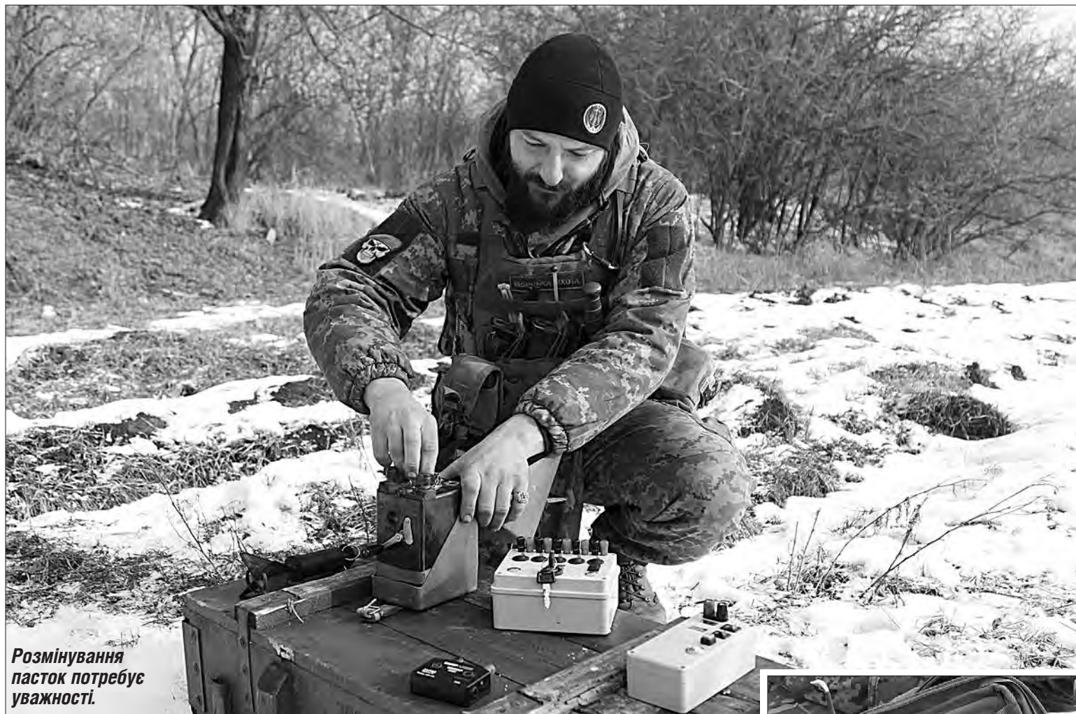
Розмінування пасток потребує уважності.

Бійці 36-ї окремої бригади морської піхоти імені контр-адмірала Михайла Білинського завжди на передньому фланзі, без їхньої роботи не зможе обійтися жоден армійський підрозділ.